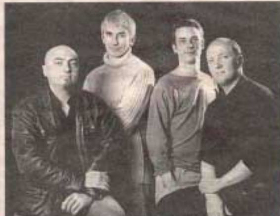
« Le groupe Guichen est la référence absolue : pêche, précision et raffinement. A partir de 23 h 15. »