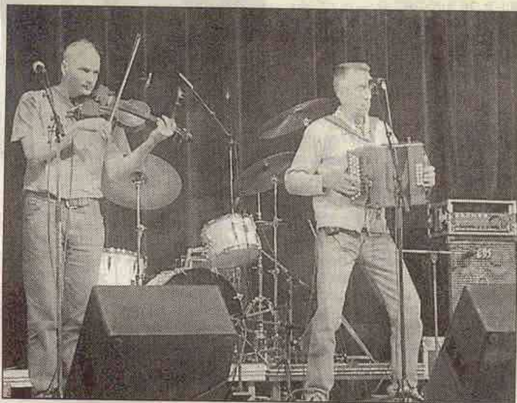
Le groupe Elfenn a ouvert le fest-noz, vendredi.