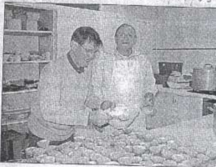
Les bénévoles en pleine préparation de la feijoada et du plat à base d'orange

□ Le Monde d'Antonio , 13, rue Louis-Jouvet, 22000 Saint-Brieuc, tél. 02 96 61 01 48. Courriel: lemonde.dantonio@libertysurf.fr et site Internet: www.lemondedantonio.com